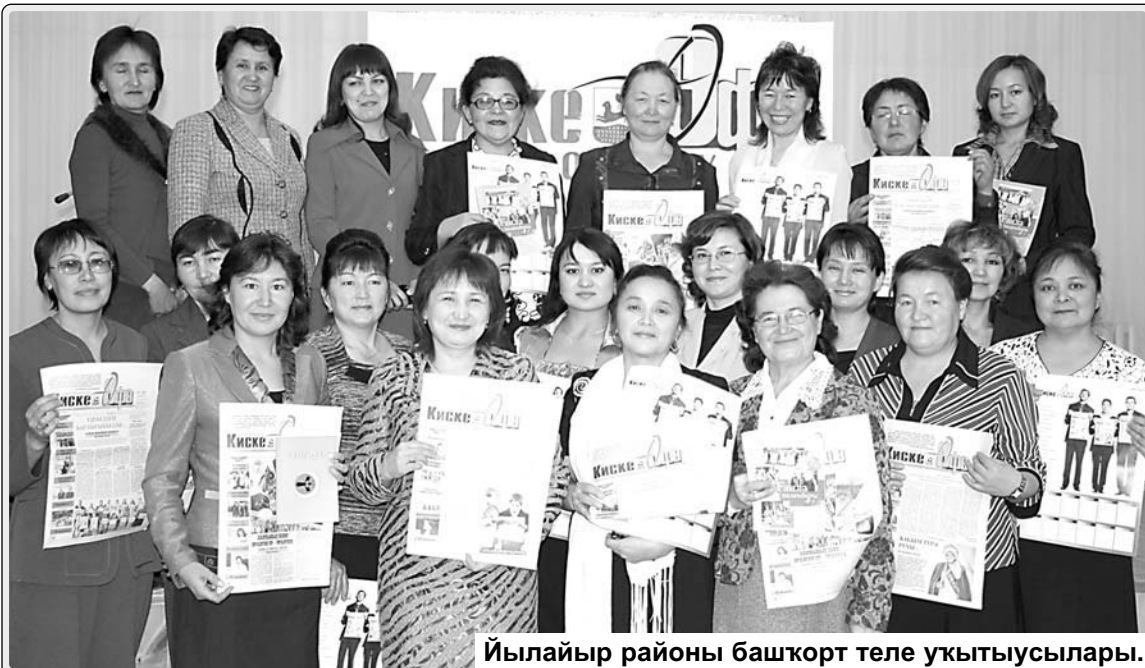
Йылайыр районы башкорт теле укытыуһылары.